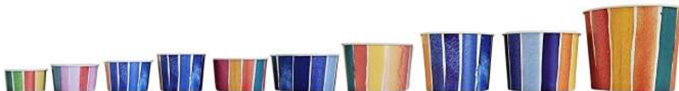
PT21 PT16B PT17 PT19 PT20 PT64 PT65 PT9T PTM58G PT90