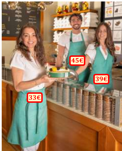
Gamme « Cuba Tiffany », modèles « Giovi », « Fac » et « Bunny », 100% polyester, taille unique.