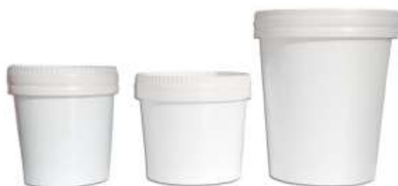
PTAL10A PT16G PTK520

Cuillère intégrée dans le couvercle PCOAL10A ;