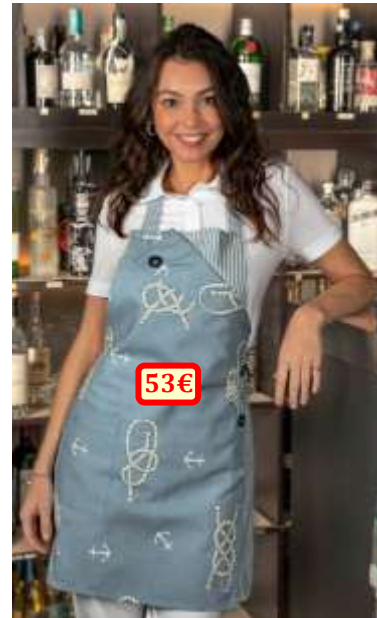
Modèle « Ancore » unisex, 100% polyester, taille unique.