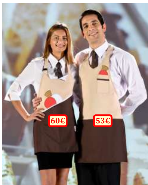
Modèles « Lucy » et « Walter », 100% polyester, taille unique.