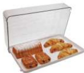
APOCR2 52,00 € -20% soit 41,60 €