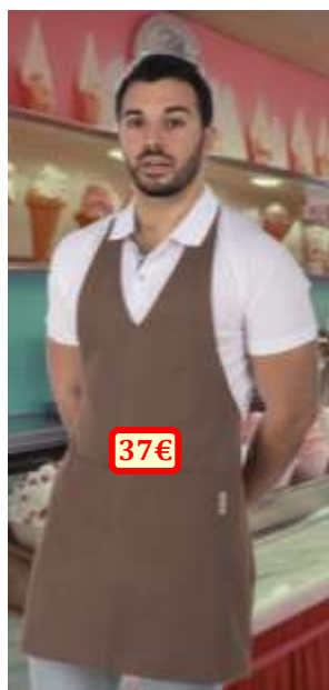
Modèle « Bunny », unisex, 100% polyester, taille unique.