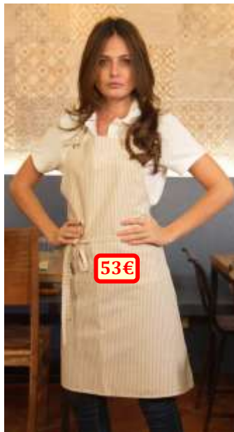
Modèle « Look » pour femme, 100% polyester, taille unique.