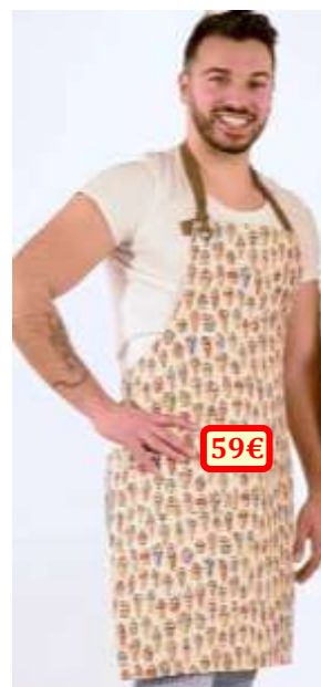
Modèle « Coni », 100% polyester, taille unique.