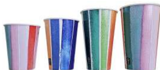
PT50 PT62 PMS42 PMS508