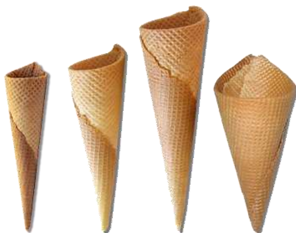
CB40 CB45 CB55 CB70